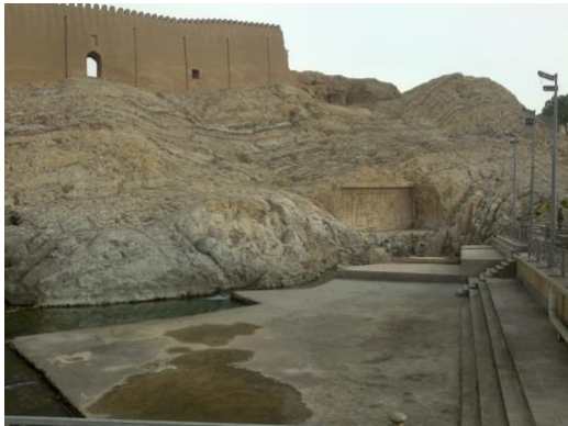
شکل ۲- منظره جدید چشمه علی

هفت خاندان بزرگ ساسانی نام داشت و بعد از اسلام بخاطر ارادت ایرانیان به امام اول شیعیان به چشمه علی تغییر نام یافت (۵).